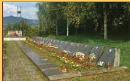
Cintorín v Sklabini

Pietnym miestom sa stal obecný cintorín v Sklabini s pomníkom, kde je pochovaných 22 bojovníkov SNP. Okrem jedného neznámeho bojovníka majú všetci na tomto pietnom mieste aj svoju fotografiu na svojom hrobe, čím toto miesto dostáva oveľa osobnejší rozmer.