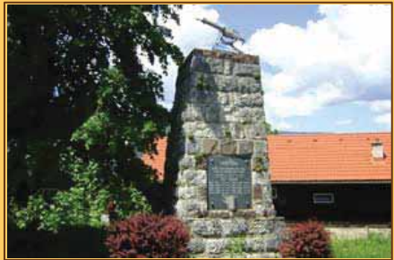
Pamätník obetiam SNP na Bystričke

Pamätník na Bystričke stojí v strede obce, v tesnej blízkosti Masarykovho domu, ktorý sa opláti tiež vidieť. Okolo pamätníka je udržiavaný malý parčík, vidno, že občania Bystričky sa s úctou starajú o pamätné miesto. Na pamätnej doske sú vytesané mená občanov, ktorí padli v SNP.