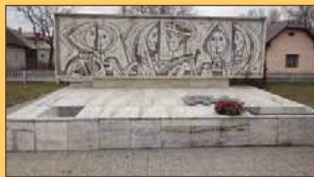
Pamätník vo Valči

Tábor vo Valči pozostával z dvoch väčších drevených bunkrov, v ktorých sa počas povstania ukrývali partizáni a utečenci z protektorátu. Bunkre prešli po vojne viacerými rekonštrukciami.