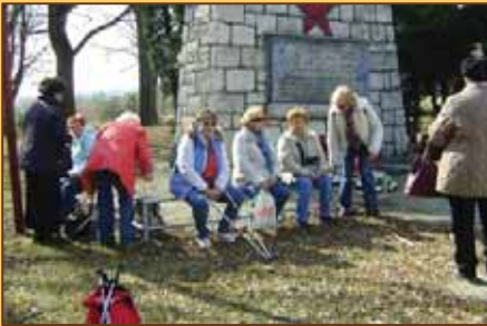
Spomienka na Bukovinách

Na tomto mieste je pamätník zavraždených 48 obyvateľov Turca (3. október 1944). Na Bukovinách boli zavraždení občania Martina, Sklabine, Vrútok, Sučian, Valče a Turian. Smutné je, že pri tomto hrozivom vyčiňaní nemeckých vojakov, pomáhali i slovenskí gardisti .