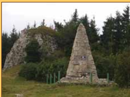
Pamätník pri Kráľovej studni

Dobrá myšlienka a nápad pripomenúť si udalosti, ktoré sa odohrali počas bojov o našu vlasť. Jedná sa o vojnové obdobie rokov 1944 - 1945, kde padlo veľa našich nielen vojakov, ale aj civilného obyvateľstva. Vďaka patrí všetkým dobrovoľníkom - partizánom, ktorí sa postavili proti nepriateľom a bojovali za nás s nasadením svojich životov.