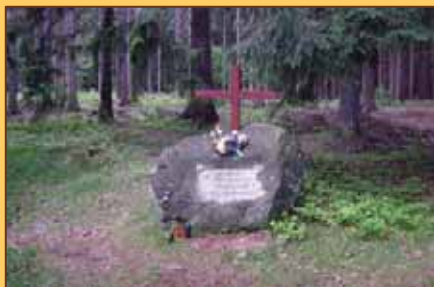
Pamätné miesto pod Malou Fatrou

Pomníky a pamätníky s desiatkami mien padlých vlastencov a umučených hrdinov, tisíce hrobov roztrúsených po slovenských horách, budú navždy pripomínať utrpenie a nesmierne obete, ale aj hrdinov a obetavosť obyvateľov kraja v národnooslobodzovacom boji.