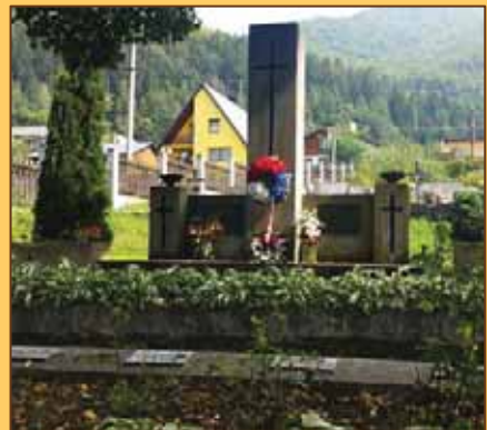
Cintorín na Lipovci

Ozbrojené povstanie v Turci začalo 29. augusta 1944, keď Nemci zaútočili na Strečiansky priesmyk, ktorý strážili partizáni na druhej strane Váhu pod vrchom Panošiná (1 022 m n. m.) – teritórium obce Lipovec. Tu nastali najsilnejšie ozbrojené boje v SNP v Turci. Partizáni tento úsek udatne bránili, avšak proti nemeckej presile, ťažkej bojovej technike – tankom a lietadlám nemali šancu. A tak 5. septembra 1944 Nemci prešli priesmykom do Hoskory na Panošínú a na Dolný Lipovec, kde vypálili 39 obytných domov a 35 hospodárskych stavísk. Preto sme putovali na toto pamätné miesto SNP, kde je hneď na začiatku obce pamätník s mottom: „Na počesť hrdinskej obce Lipovec, ktorá bola za účasť občanov v SNP 5. septembra 1944 fašistami vypálená a v oslobodenej vlasti obnovená.“