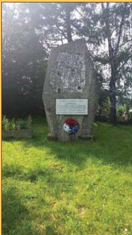
Pamätník na Lipovci