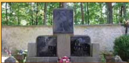
Hrob bratov zavraždených v SNP

Na cintoríne v Necpaloch pri katolíckom kostole môžeme vidieť hrob dvoch bratov, ktorí boli zabití na úteku. Podľa miestnych občanov nemeckí vojaci boli aj na pohrebe, čo dokazuje ľútosť týchto ľudí voči skutkom, ktoré páchali, ako aj nezmyselnosť vojny.