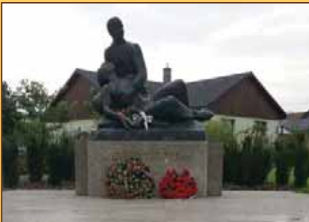
Pamätník v Sučanoch

Sučianski občania počas SNP v značnom počte bojovali v radoch povstaleckej armády, ako aj v partizánskych brigádach, o čom svedčí 43 padlých, z toho 21 v bojoch o Sučany.