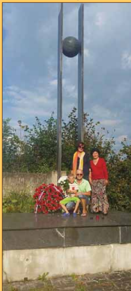
Pocta štyroch generácií v Sklabini

Preto sme pri tomto pomníku symbolicky odovzdali štafetu nezabudnutia a nezabúdania významu SNP a to v zastúpení štyroch generácií: prastará mama, jej dcéra, jej vnuk a pravnuček – šesťročný prváčik, ktorý položil kytku kvietkov na tomto pomníku. Čo sme zdokumentovali na fotografii.