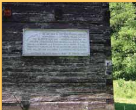
Pomník v Kantorskej doline

Sú to predovšetkým pomníky v povstaleckej obci Sklabini. Pomník na lúke v Kantorskej doline, ktorá sa stala významným strategickým miestom pomoci povstania.