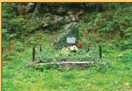
Pamätné miesto v ústí Blatnickej doliny

V našom kraji Turiec je veľa pamätníkov týmto padlým a zavraždeným občanom v SNP.