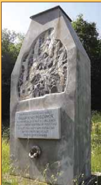
Pamätník v Sklabinskom Podzámku

Pamätaj živý, na obeť boja, na utrpenie padlých pomysli, ako šli do ohňa a do príboja, za tvoje sny a tvoje pomysly.