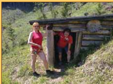
Partizánske bunkre vo Valčianskej doline

Počas našich prechádzok a poznávaní krásneho kraja Turiec, sme navštívili aj obec Valča, ktorá sa nachádza len 14 km od Martina. Naše putovanie viedlo až do Valčianskej doliny, kde práve tu cez povstanie založili v Bazovej vo Valčianskej doline záchytný sústreďovací tábor, z ktorého rozdeľovali skupiny partizánov do ďalších táborov v Turci.