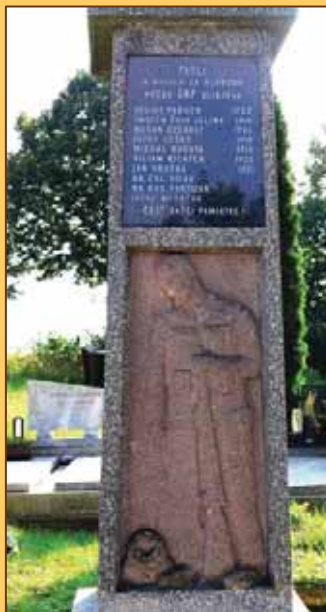
Pamätník na cintoríne v Košťanoch nad Turcom