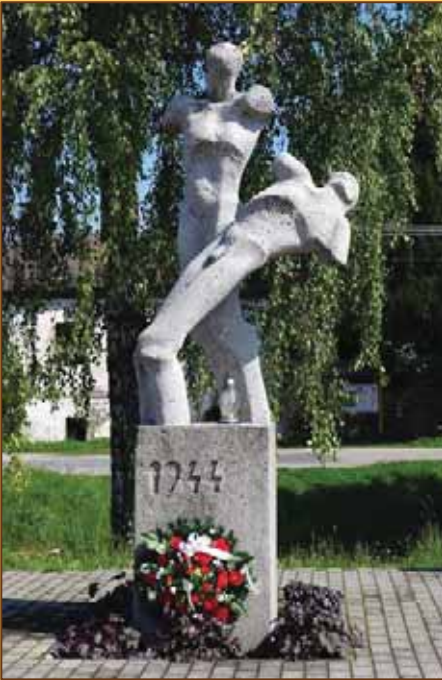
Pamätník v Necpaloch