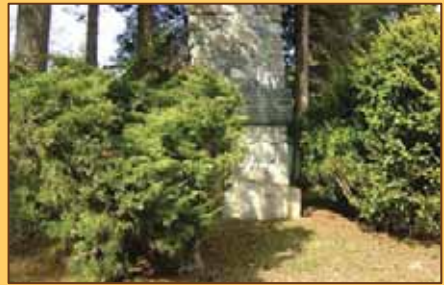
Pamätník pri horárni na Stránach

Stráne – pri horárni je pamätník SNP. V tejto horárni bol založený a sídlil tu prvý partizánsky štáb SNP pre oblasť Turca, ktorý od januára do augusta 1944 sústreďoval slovenských, sovietskych a francúzskych partizánov a organizoval boj proti fašistickým okupantom.