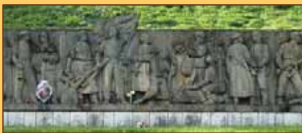
Partizánsky cintorín v Priekope

ski a iní junáci, ktorí bojovali v národnom povstaní a padli ako hrdinovia.