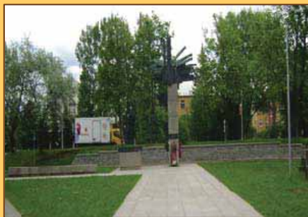
Pamätník Pušky Martin - Sever