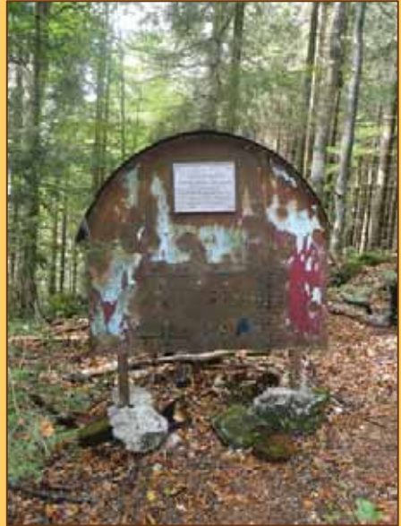
Partizánska pec nad Blatnickou dolinou

Doliny poskytnú oddych tým, ktorí ho po práci hľadajú, tak ako poskytli partizánom Slovenského národného povstania v rokoch 1944 - 1945. Doliny ich ochránili pred fašistami, ktorí sa báli vstúpiť do týchto tajomných roklin, kde každý strom bojoval proti nim. Dnes sa už bunkre, v ktorých partizáni prežívali, rozpadávajú a príroda prikrýva miesta bojov svojou bujnou krásou. Na miestach, kde predtým pulzoval život partizánov, dnes nájdeme pamätné tabule, ako napríklad aj túto, vypovedajúcu o tom, že v horách Veľkej Fatry žili partizáni.