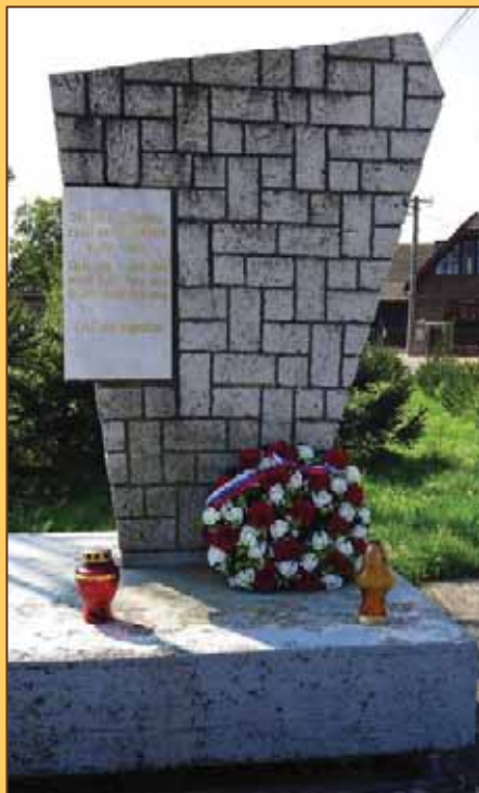
Pamätník v Nolčove

V období odbojového hnutia v Turci medzi obcami poskytujúcimi pomoc utečencom z nemeckého zajatia má významné miesto aj obec Nolčovo. V obci majú umiestnenú pamätnú tabuľu občanov, ktorí padli v SNP za našu vlasť.