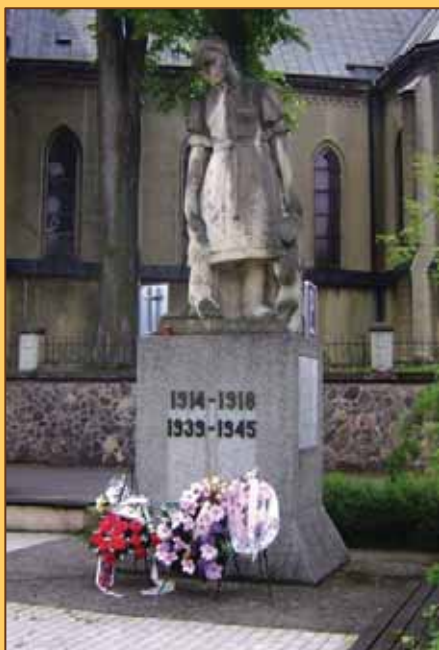
Spomienka na I. a II. svetovú vojnu vo Vrútkach