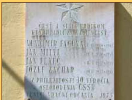
Detail Pamätníka v Nolčove