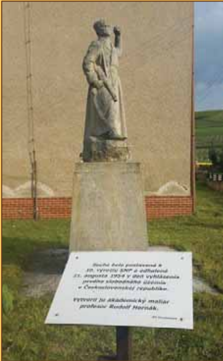
Pamätná socha v Sklabini

Ďalšími monumentmi v tejto obci sú: socha partizána, ktorá sa nachádza pred bývalou evanjelickou školou, dom Samčíkovicov a dve pamätne tabule na domoch, z ktorých sa uskutočňovalo spojenie s vysielaczkami do Kyjeva.