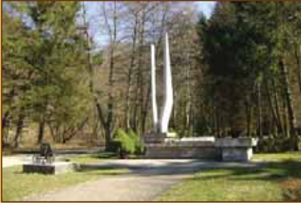
Pamätník v Blatnici

Tak sme došli na rázcestie medzi Blatnickou a Gaderskou dolinou, kde v krásne vybudovanom Parku národov v objatí končiarov Veľkej Fatry stojí pomník SNP, ktorý vysoko týči svoje dva ostré obelisky, aby nám pripomínal to, čo je v jeho motte: „Z dvoch dolín vrchmi chránený, tu život proti smrti šiel.“